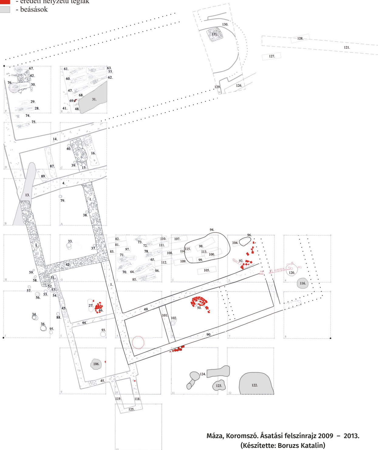
Máza, Koromszó. Ásatási felszínrajz 2009 – 2013. (Készítette: Boruzs Katalin)