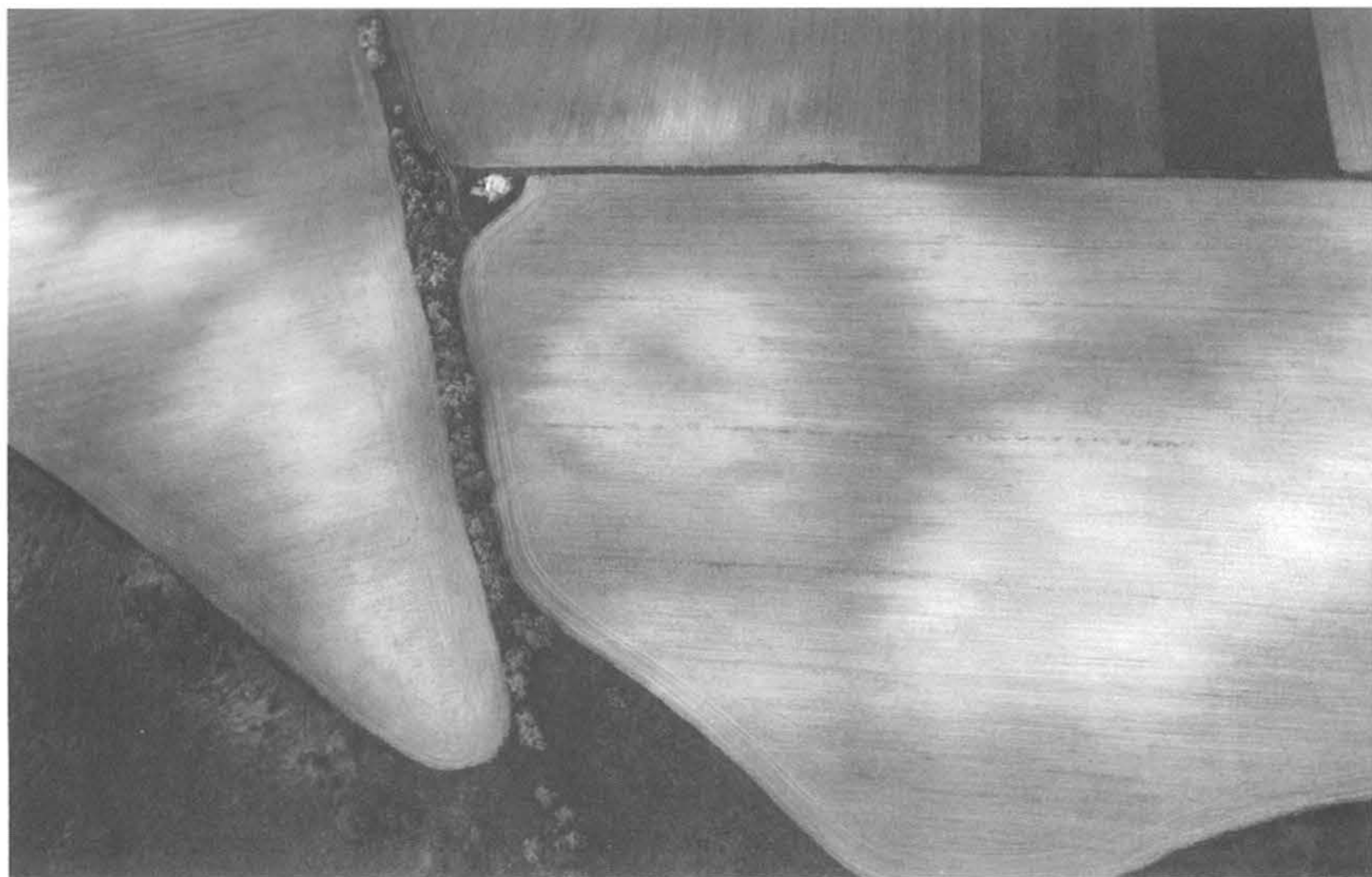
7. kép. Fig. 7: Tura, Vajda-rét (2005. május 25.; May 25, 2005)