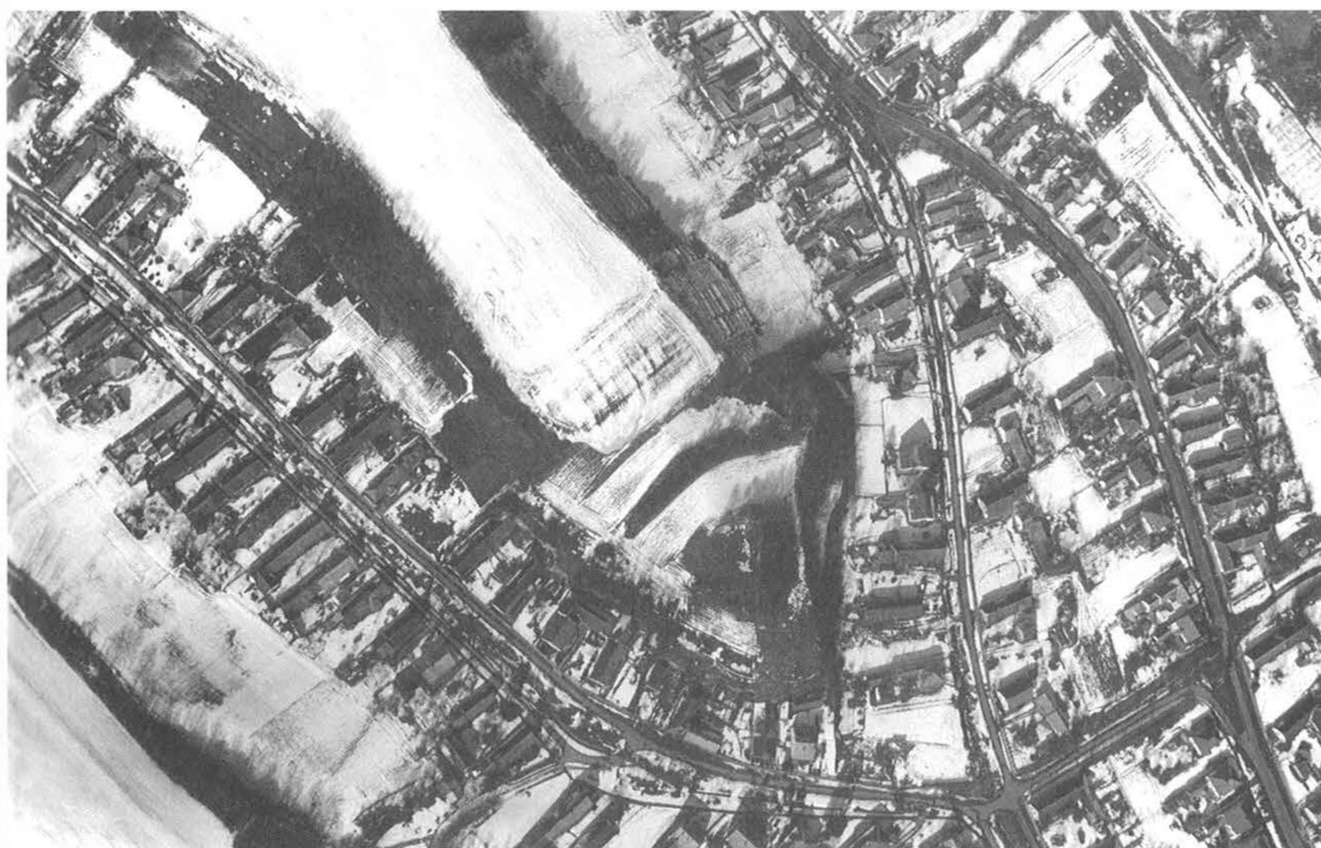
6. kép, Fig. 6: Tevel, Schanzberg (2005. március 2.; March 2, 2005)