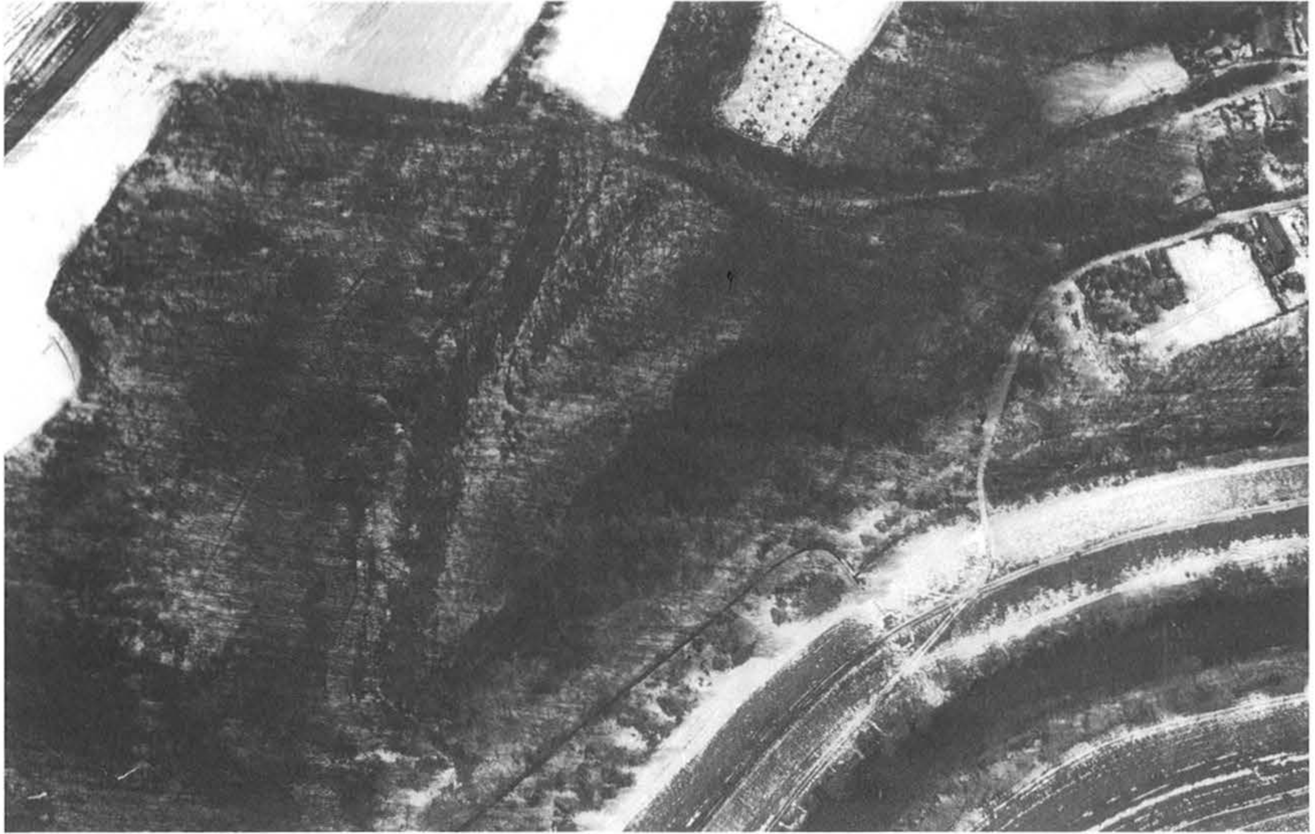
3. kép, Fig. 3: Harc, Várhegy (2005. március 2.; March 2, 2005)