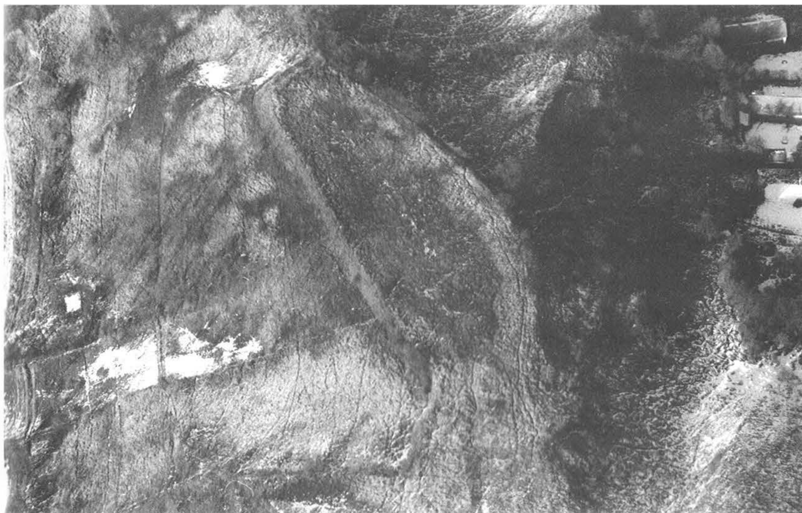
5. kép, Fig. 5: Tamási, Kishenyve (2005. március 2.; March 2, 2005)