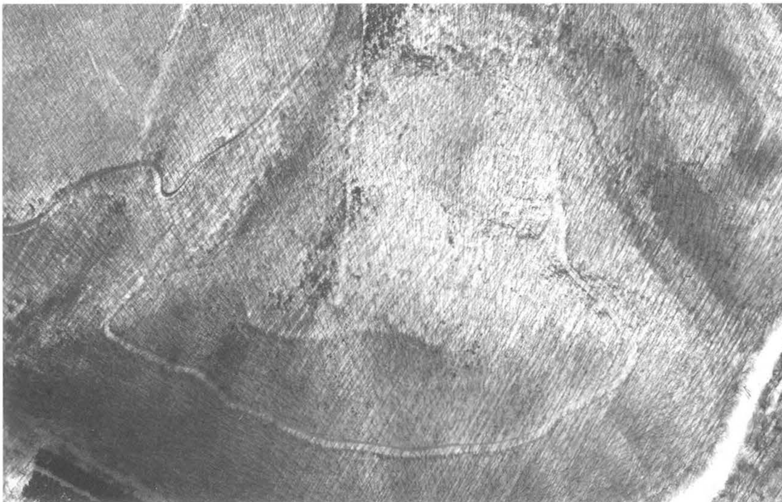
1. kép, Fig. 1: Bátorfő, Gesztenyész-völgy (2005. március 2.; March 2, 2005)