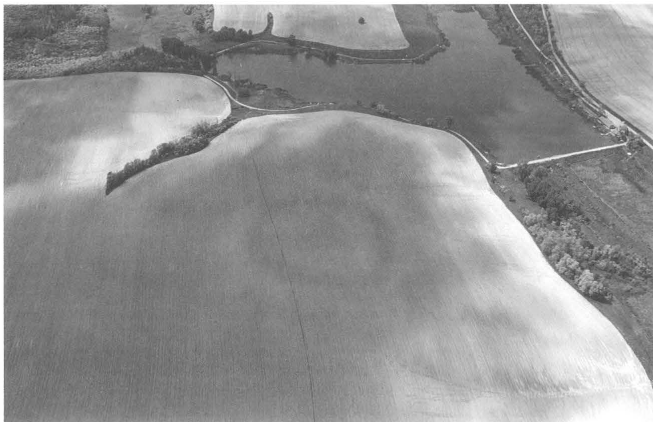
8. kép. Fig. 8: Úri, DK (2005. május 25.; May 25, 2005)