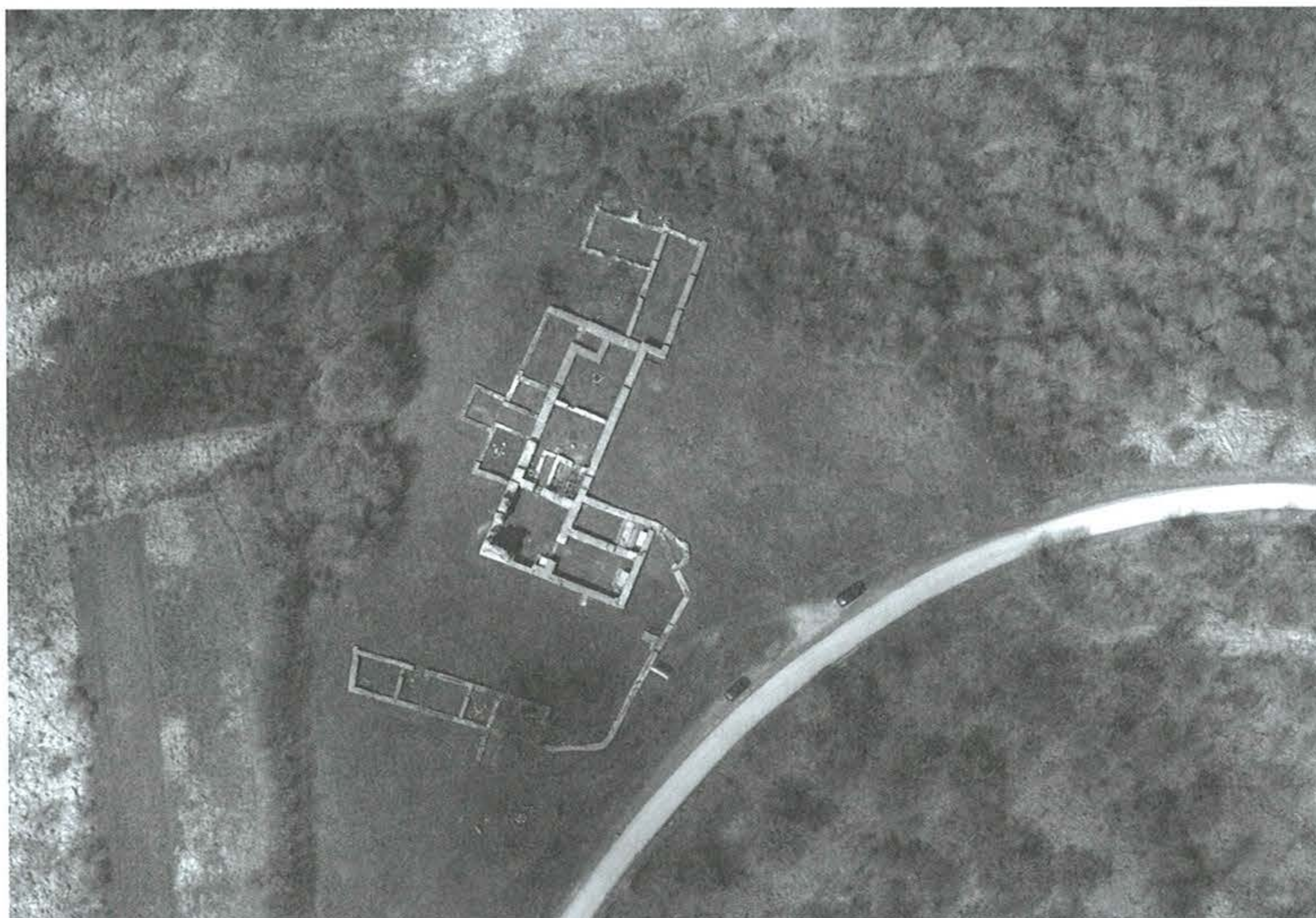
2. kép: Esztergom-Pilisszentlélek, kolostorrom. 2010. április 7.