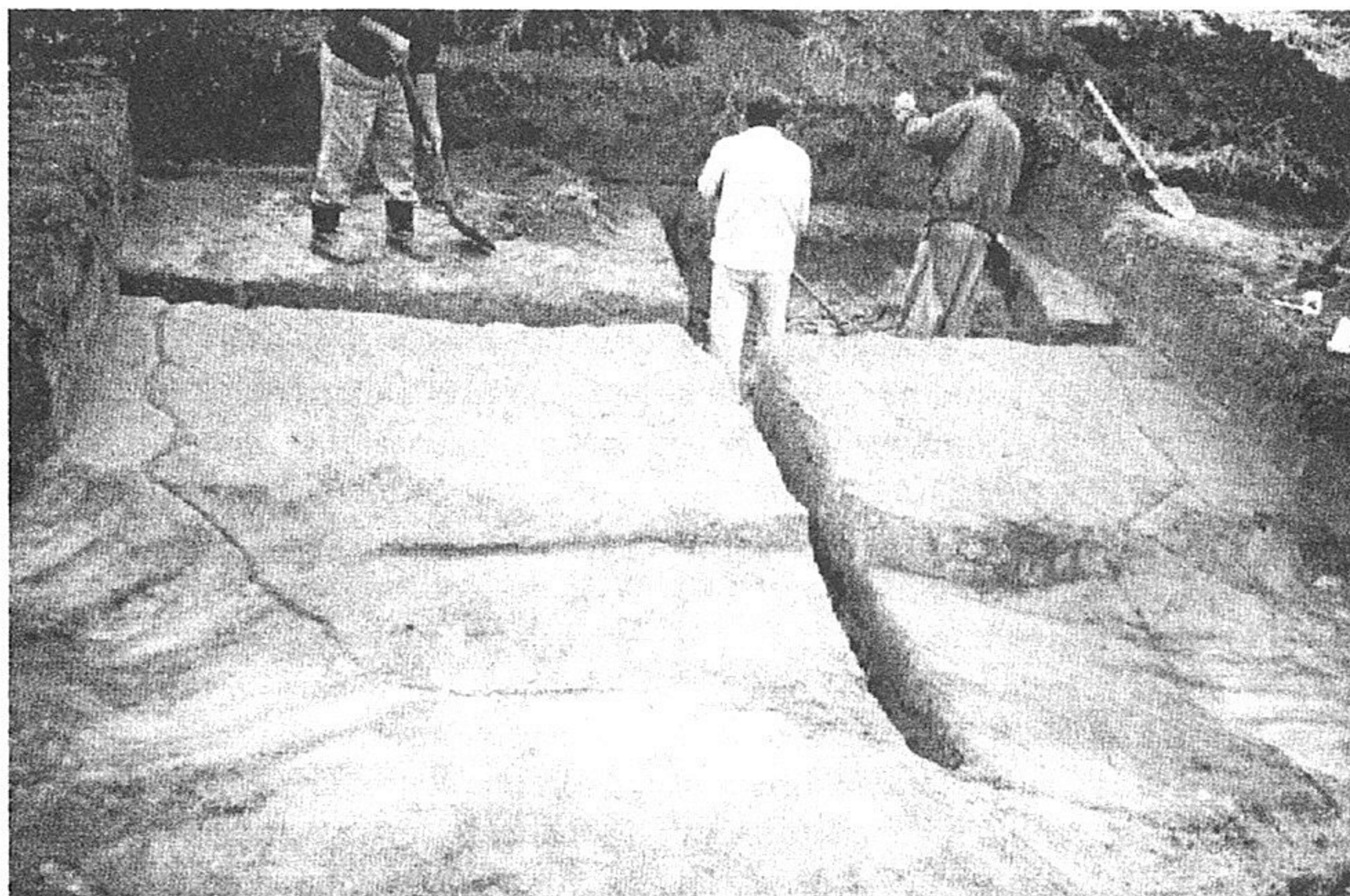
3. kép: Késő kelta ház bontása Fig. 3. Clearing of the late Celtic house