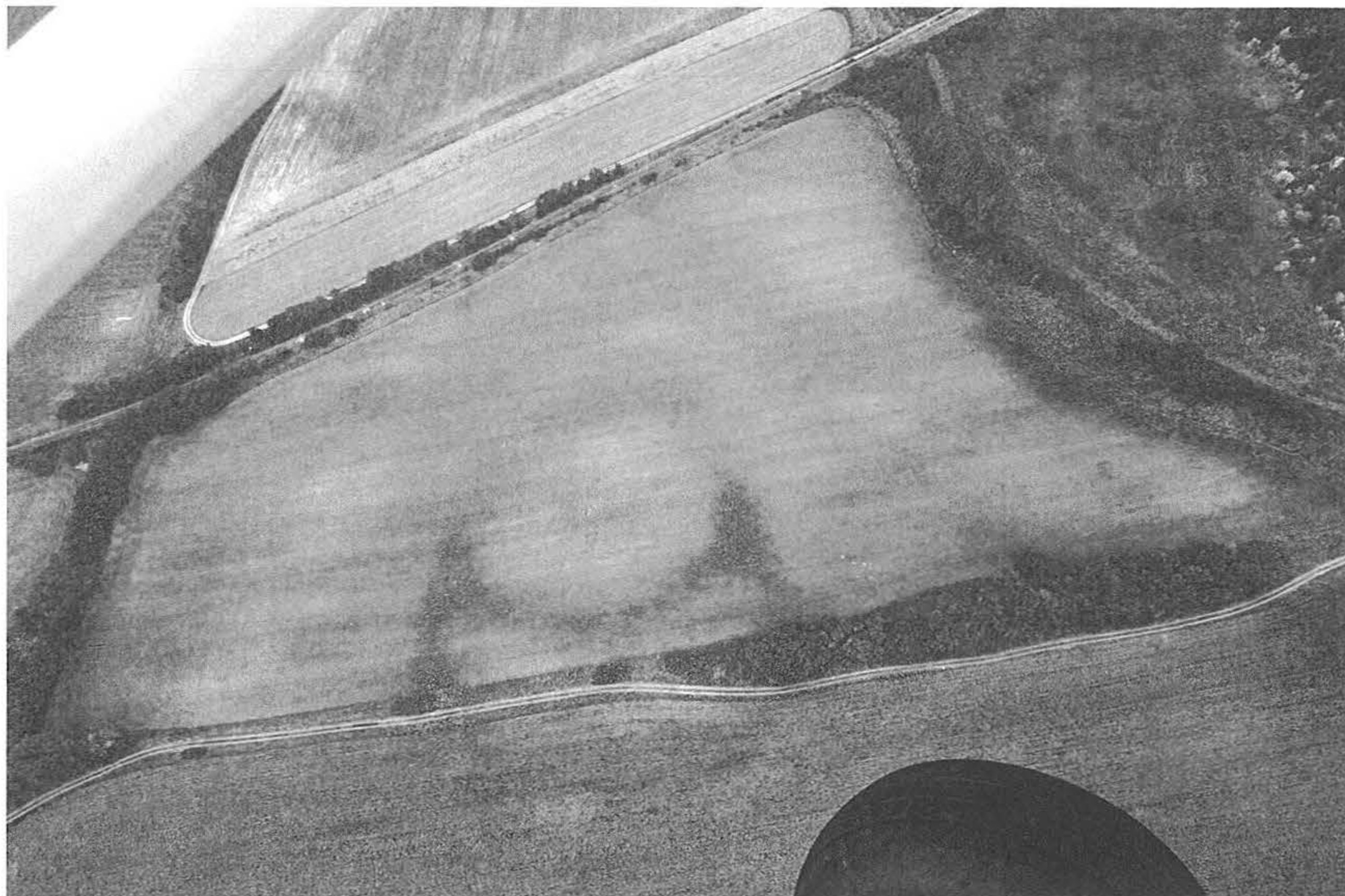
3. kép, Fig. 3.: Kakucs, Turján mögött (2007. június 18.; June 18, 2007)