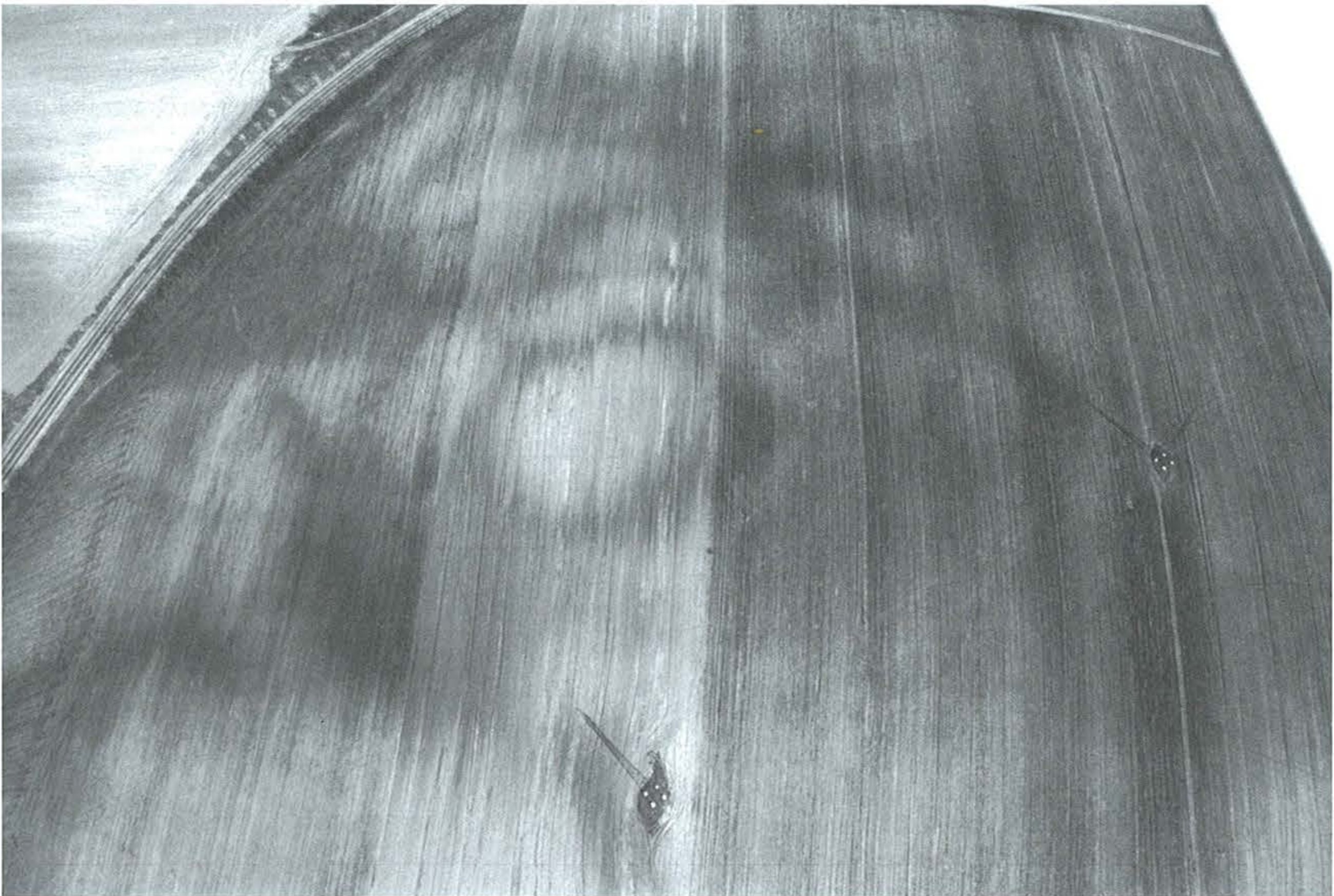
2. kép, Fig. 2.: Bia, Papréti-dűlő (2007. március 27.; March 27, 2007)