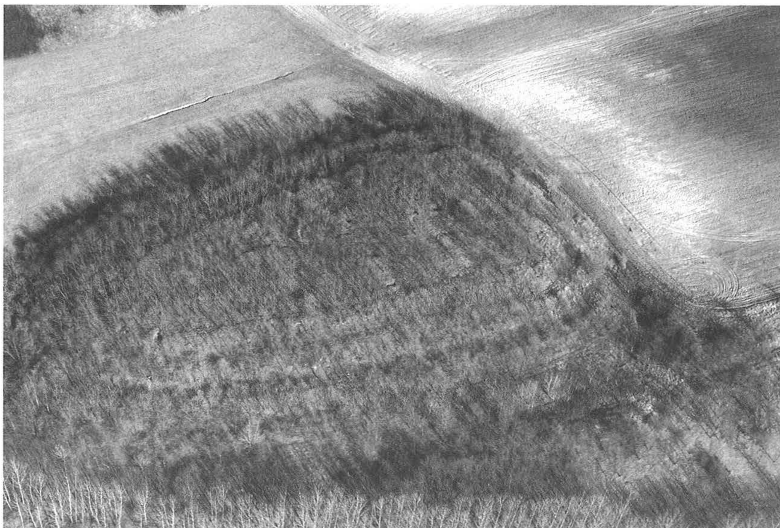
4. kép, Fig. 4.: Mende, Leányvár (2007. március 14.; March 14, 2007)