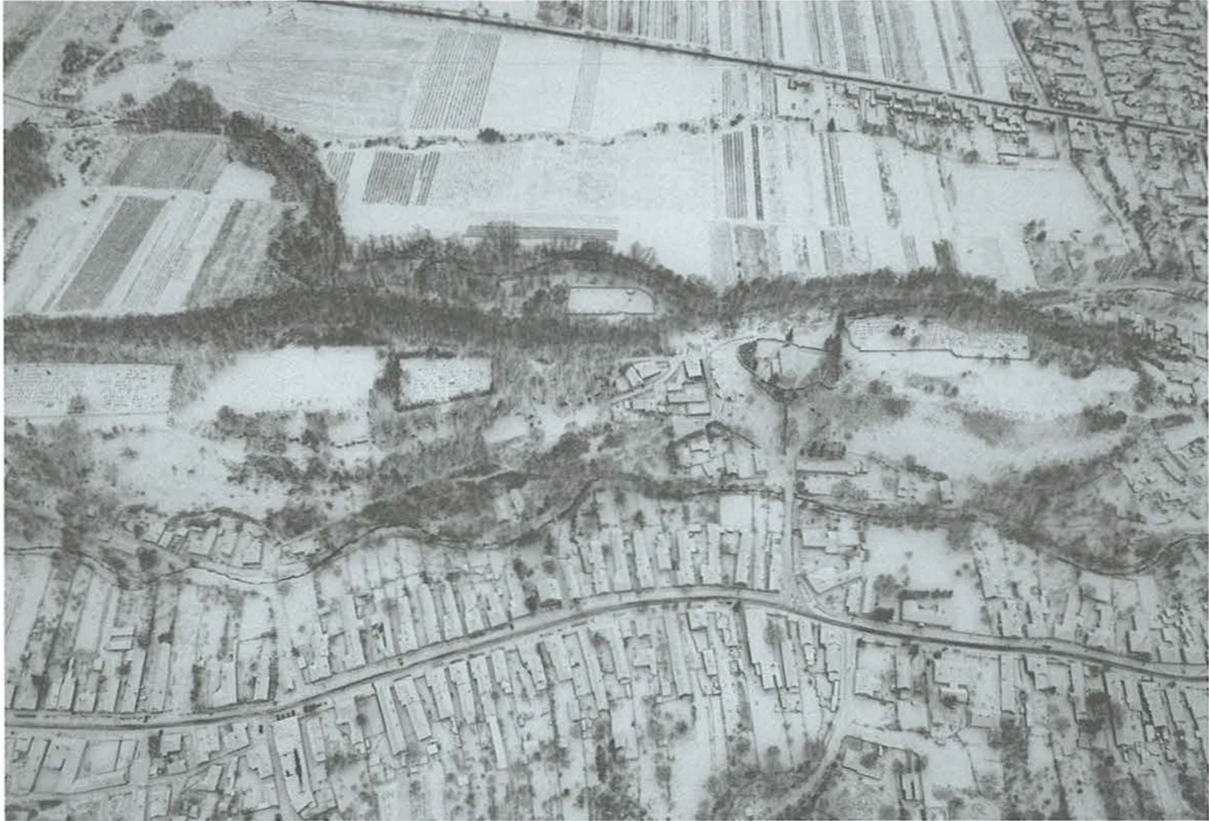
3. kép: Bernecebaráti, Templom-hegy. 2010. február 4.