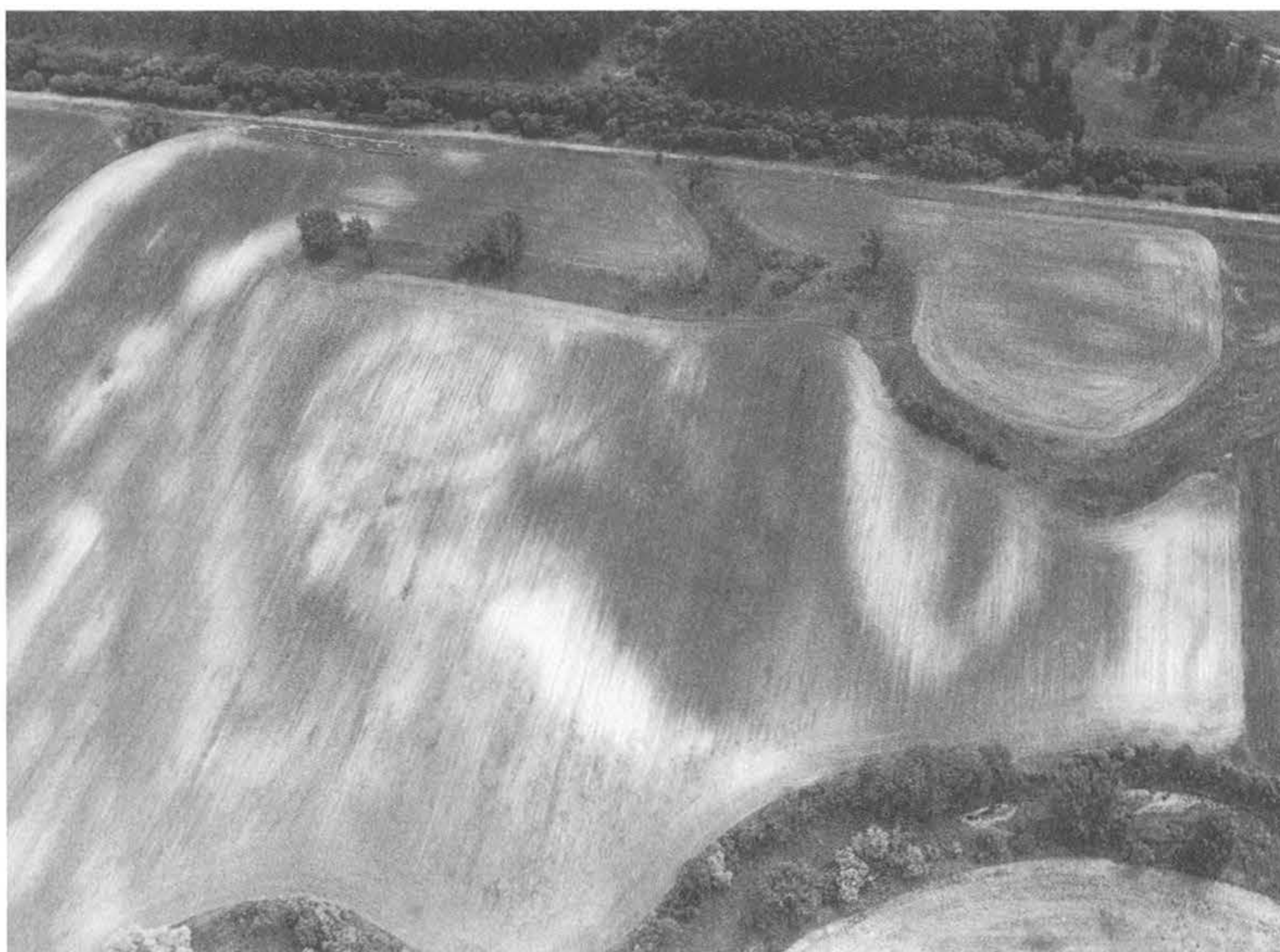
6. kép – Fig. 6: Bölcse, Szélesdombi-dűlő