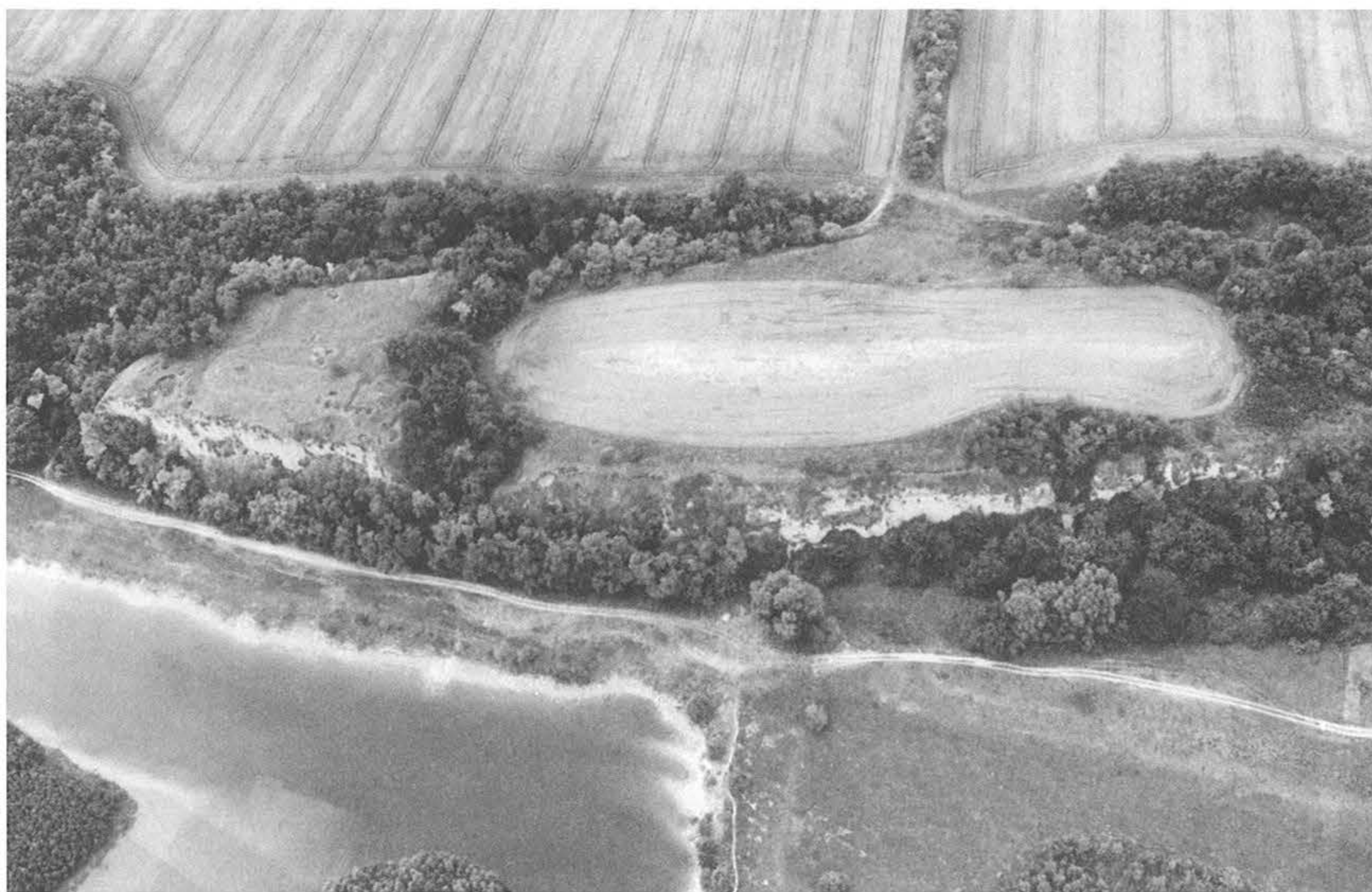
7. kép – Fig. 7: Döbrököz, vár