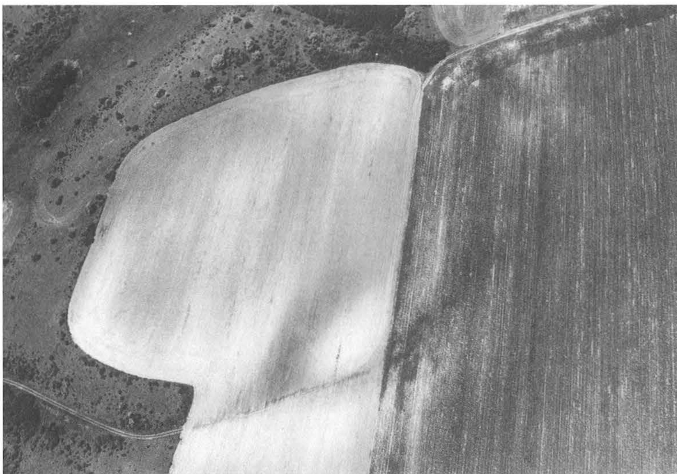
5. kép – Fig. 5: Bikács, Belső sziget