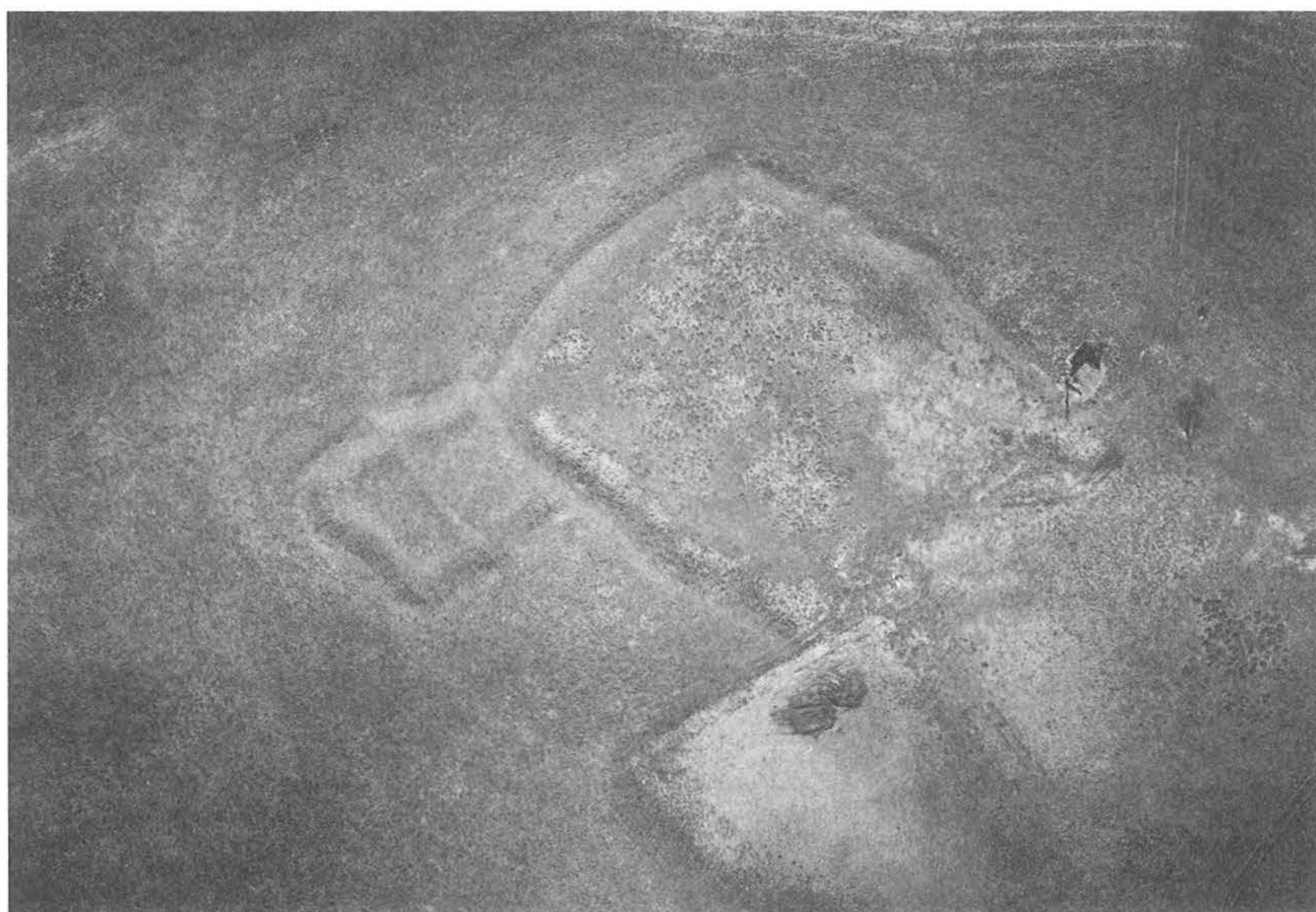
10. kép – Fig. 10: Nak, ÉNy