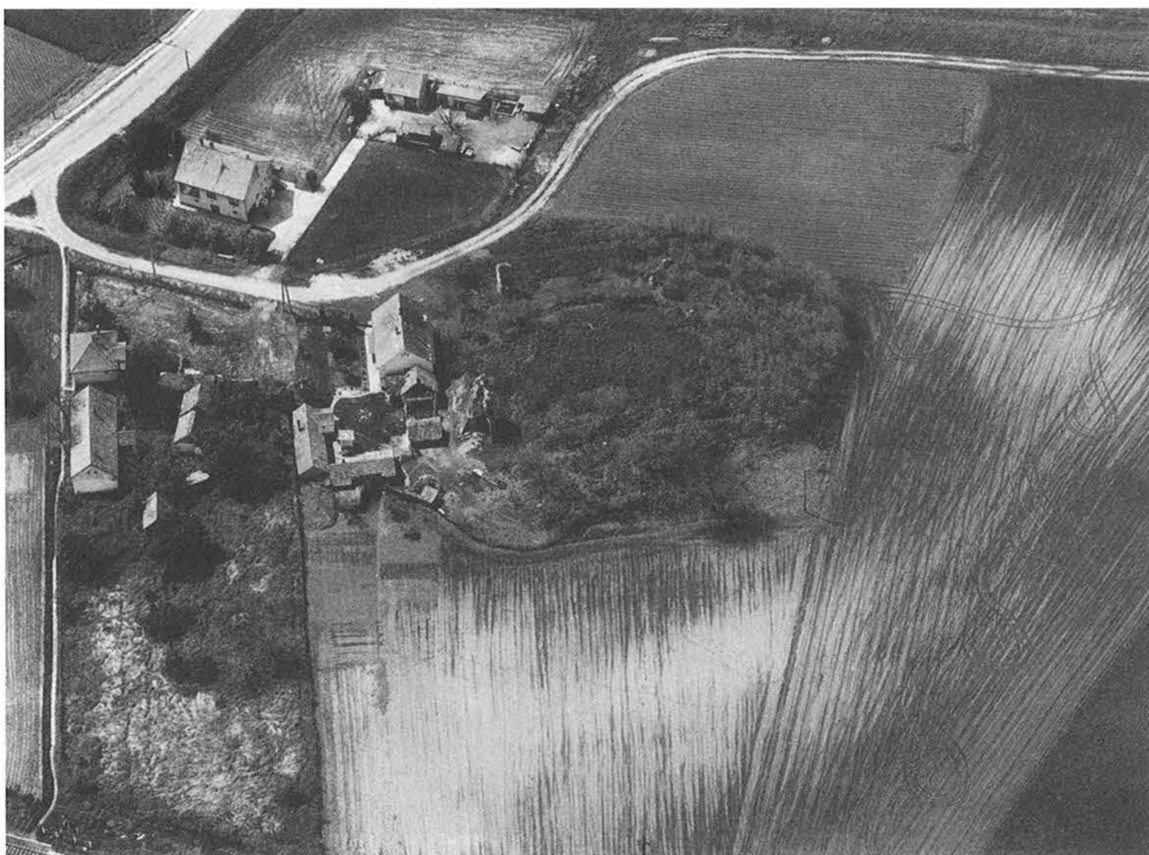
1. kép – Fig. 1: Sárbogárd, Hatvan-puszta