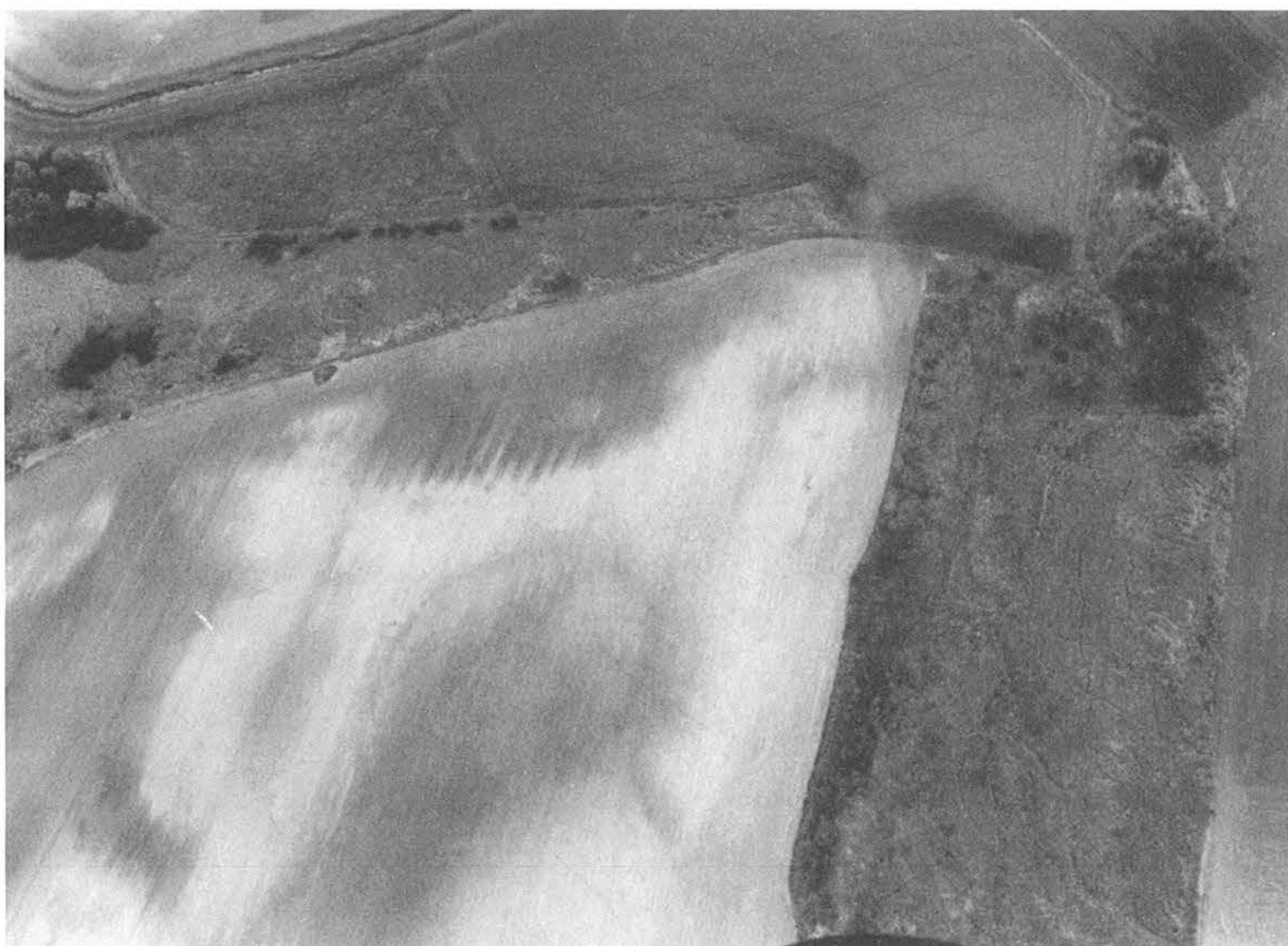
4. kép – Fig. 4: Belecska, juhászat