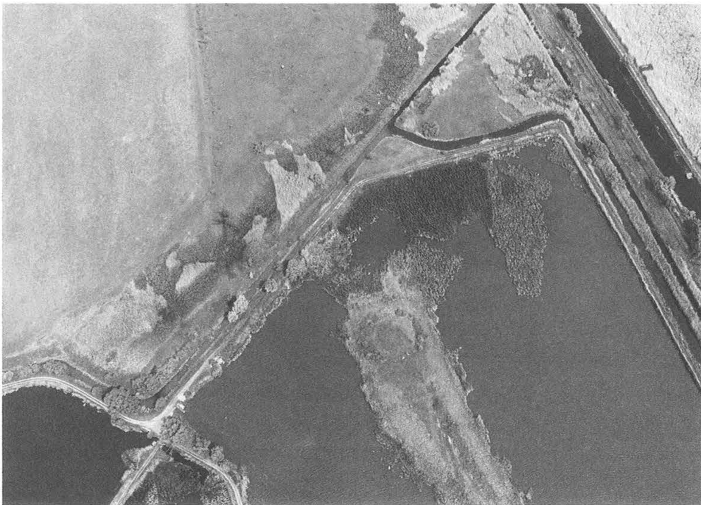
3. kép – Fig. 3: Nagymaros, Szentmihály-hegy