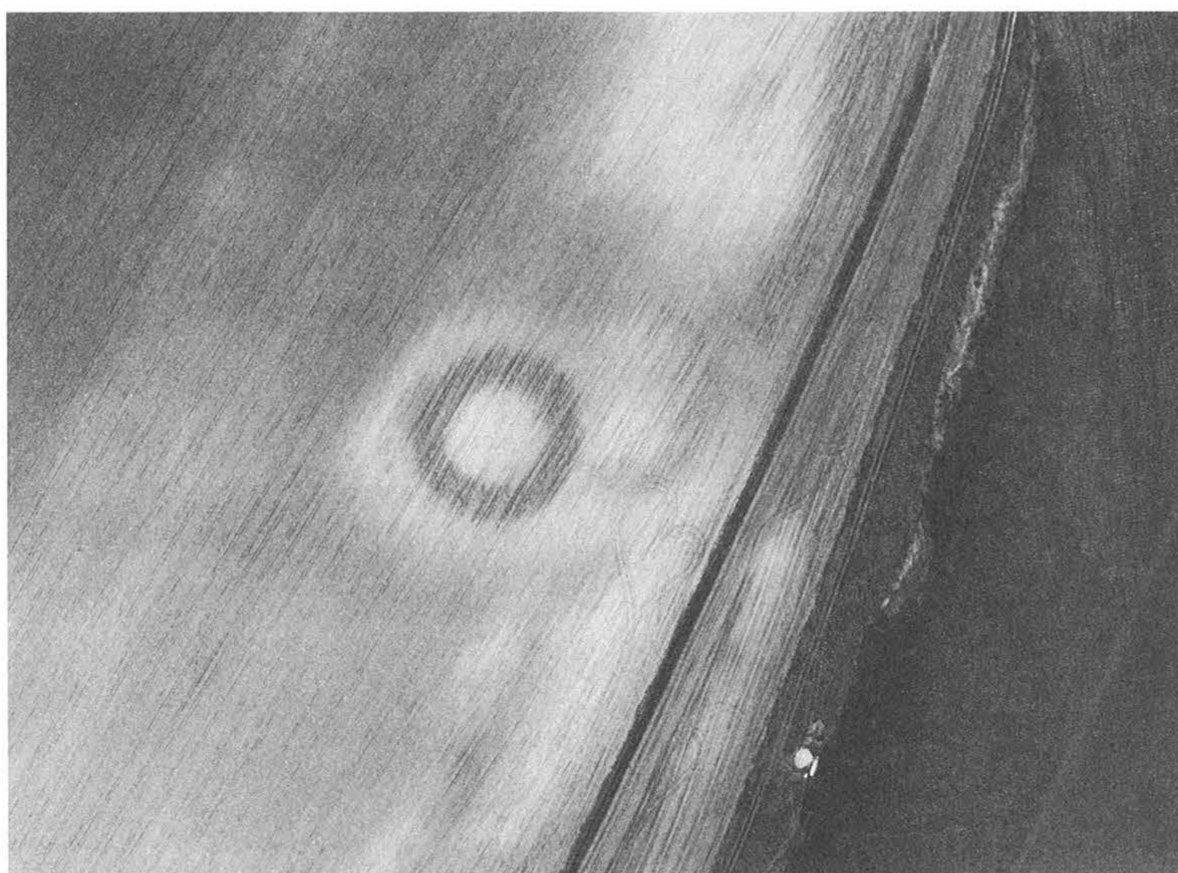
2. kép – Fig. 2: Sárbogárd, Mindszent-puszta