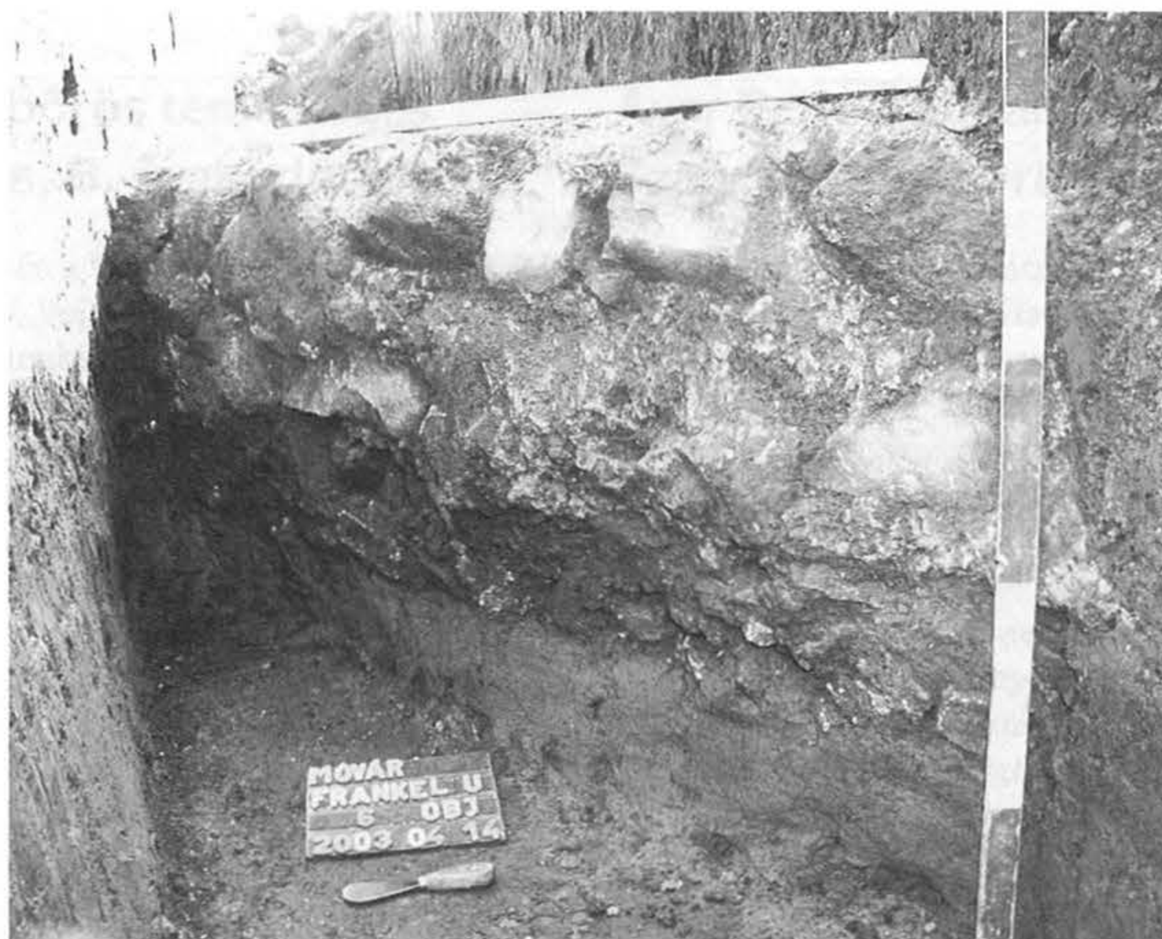
4. kép: Frankel utca, 2003. évi ásítás, a 6. objektum nyugatról fotózva