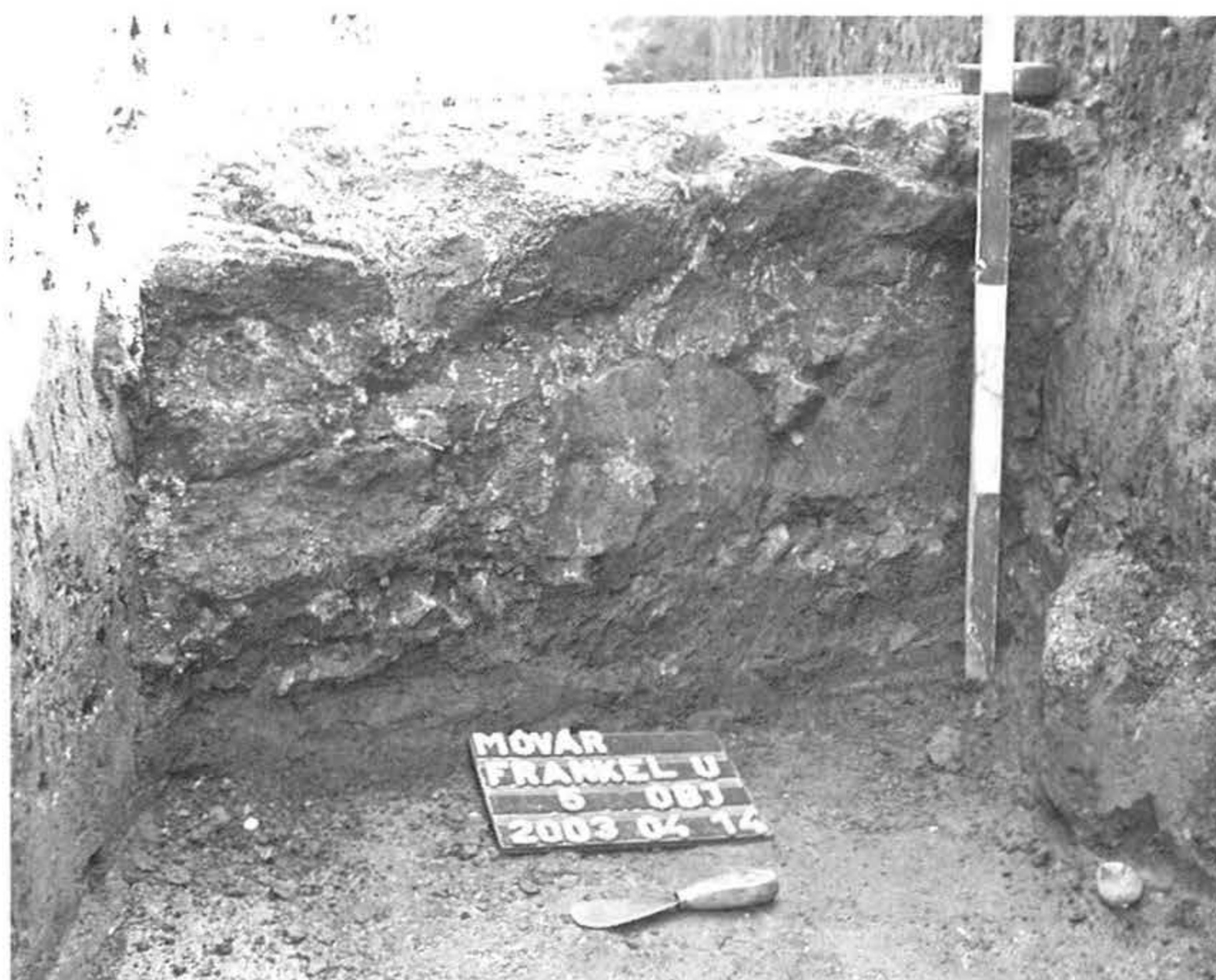
3. kép: Frankel utca, 2003. évi ásítás, az 5. objektum nyugatról fotózva

Fig. 2: Excavation in Frankel Street, 2003, features 5-6 from the west