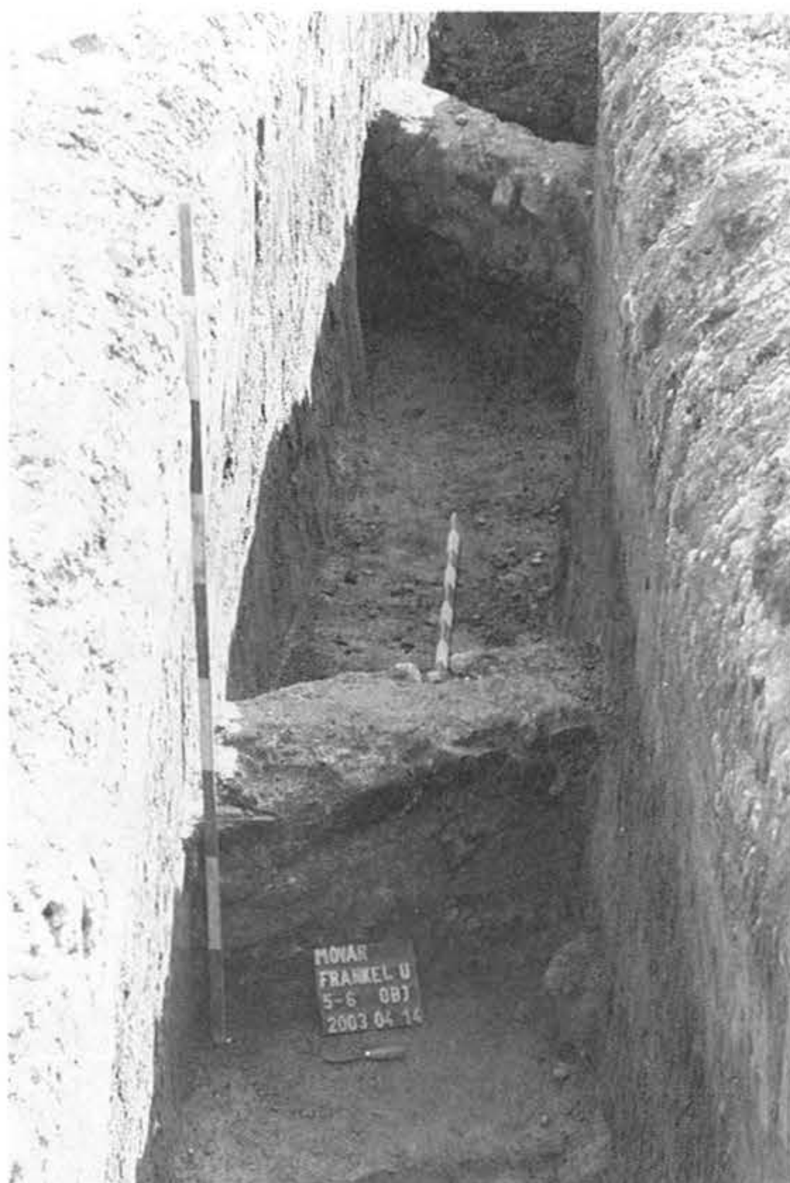
2. kép: Frankel utca, 2003. évi ásítás, az 5-6. objektum nyugatról fotózva

Fig. 2: Excavation in Frankel Street, 2003, features 5-6 from the west