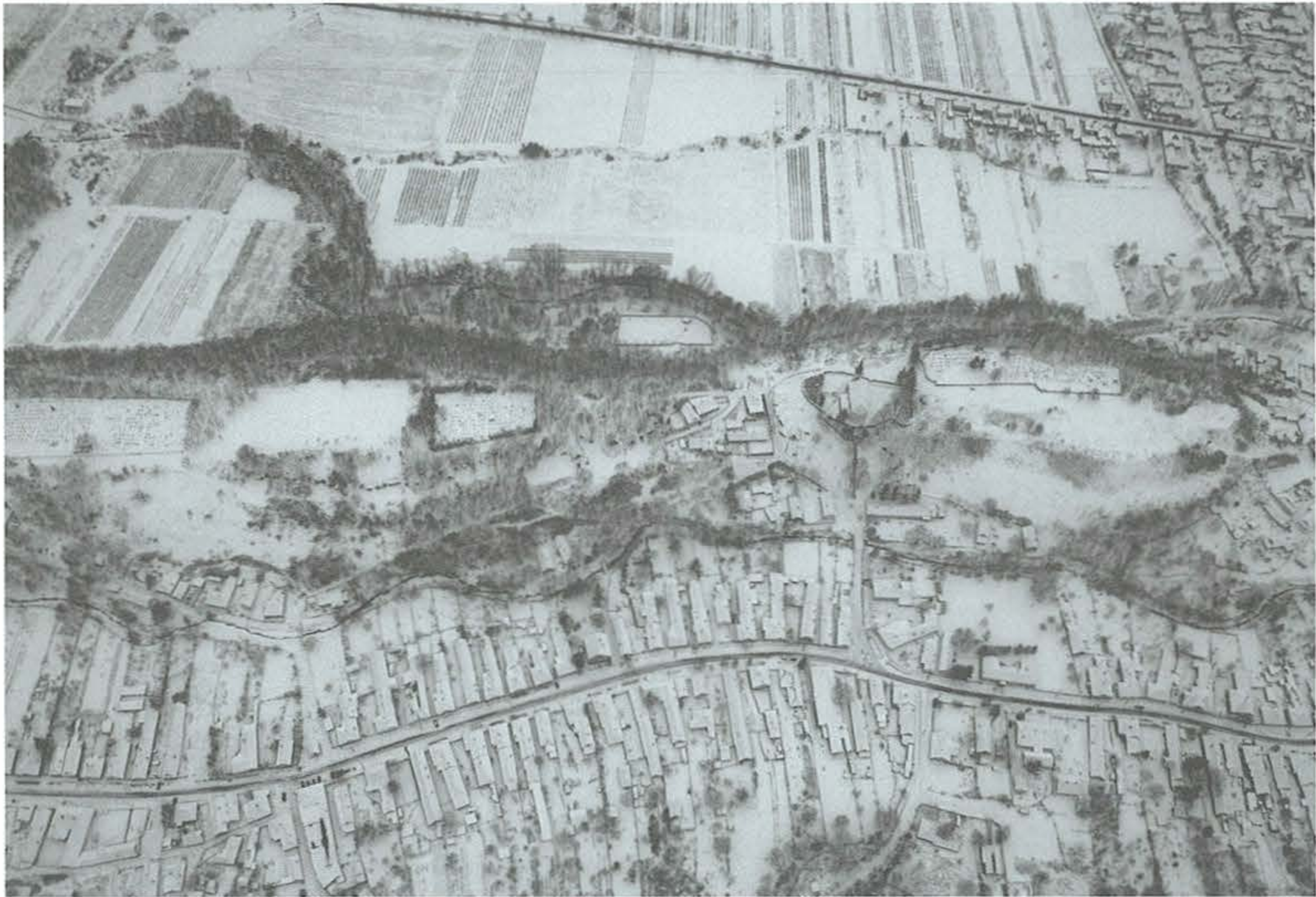
3. kép: Bernecebaráti, Templom-hegy. 2010. február 4.