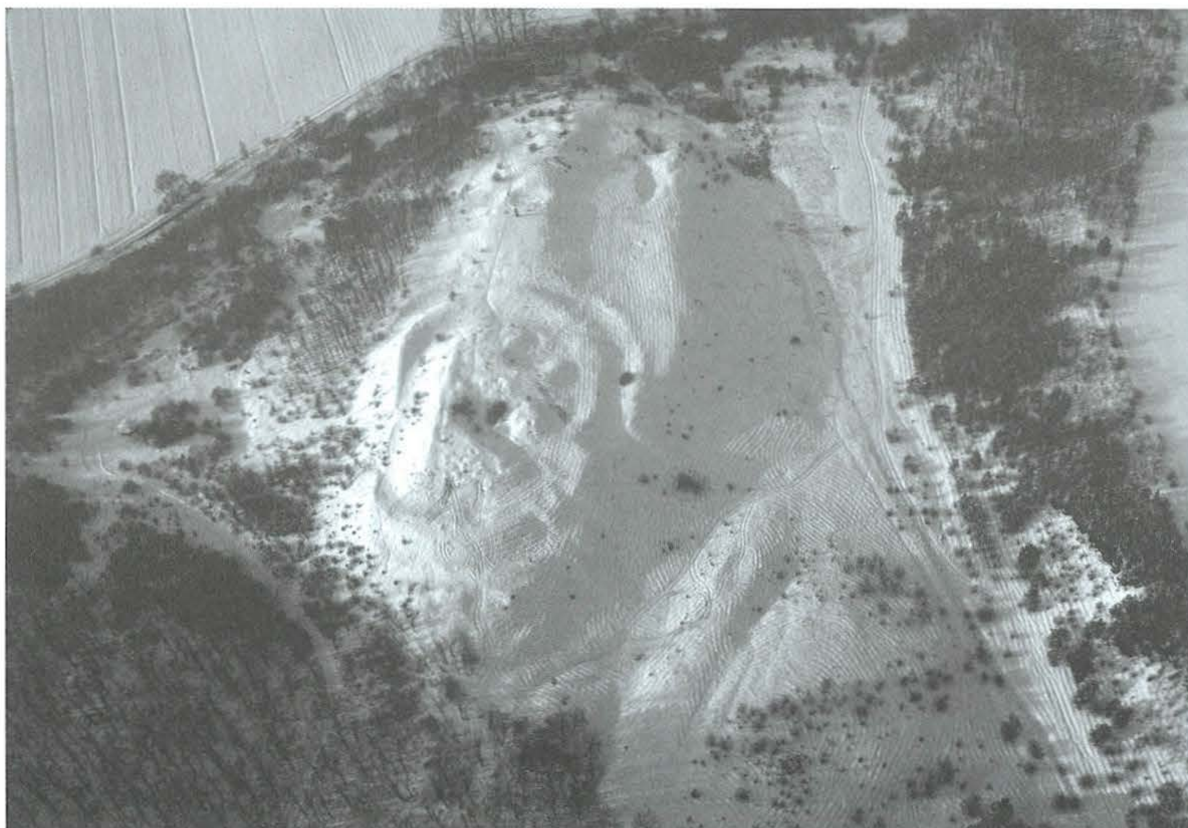
5. kép: Galgahévíz, Szent András part. 2010. február 8.