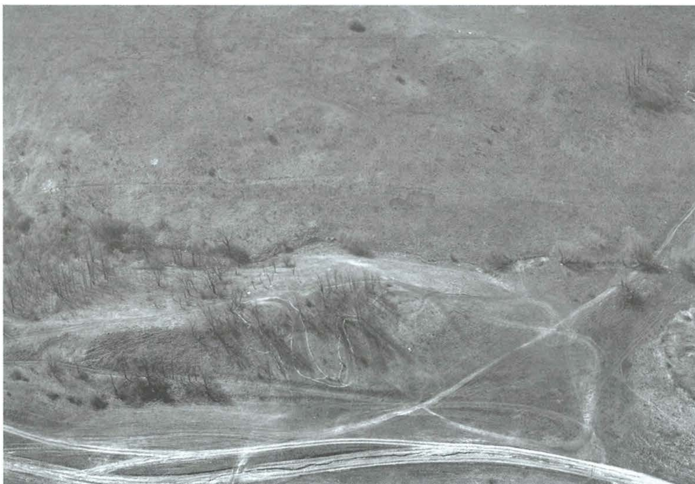
7. kép: Tinnye, Kisvár. 2010. április 7.