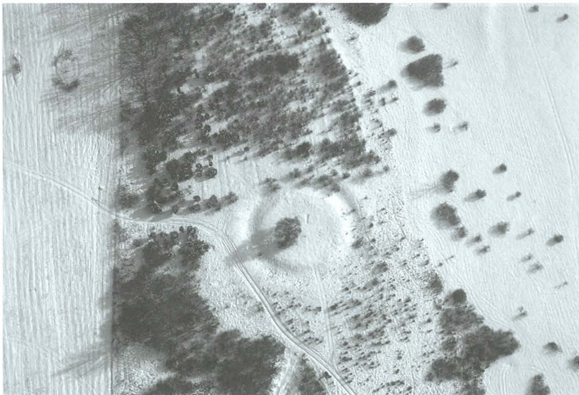
4. kép: Csévharaszt-Pusztapótharaszt, földvár. 2010. február 8.