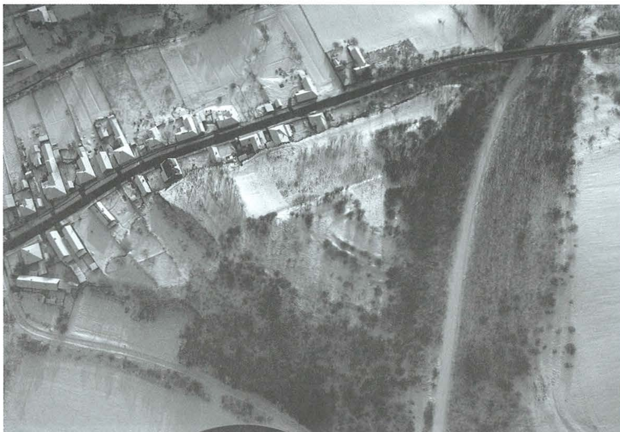
6. kép: Galgamácsa, Szilvás-domb. 2010. február 8.