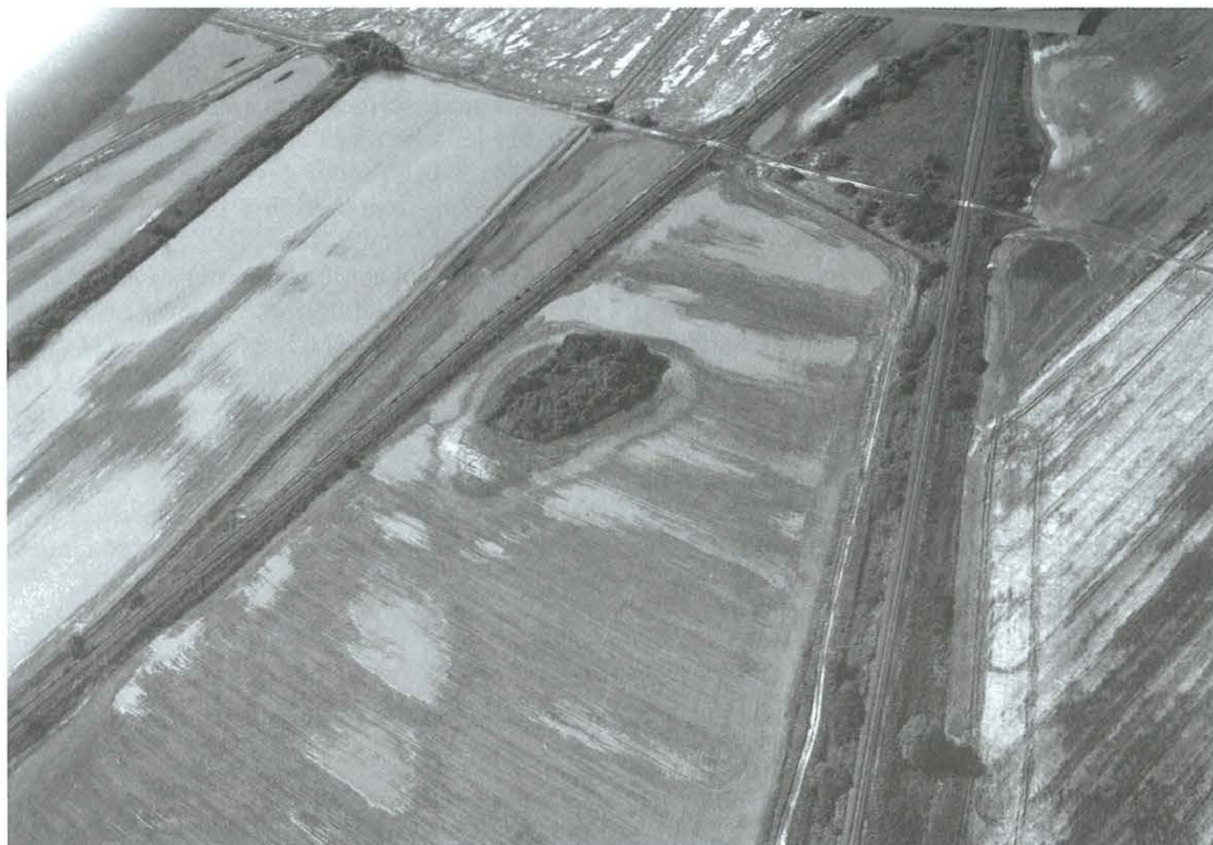
8. kép: Kaposzekcső, Leányvár. 2010. június 11.