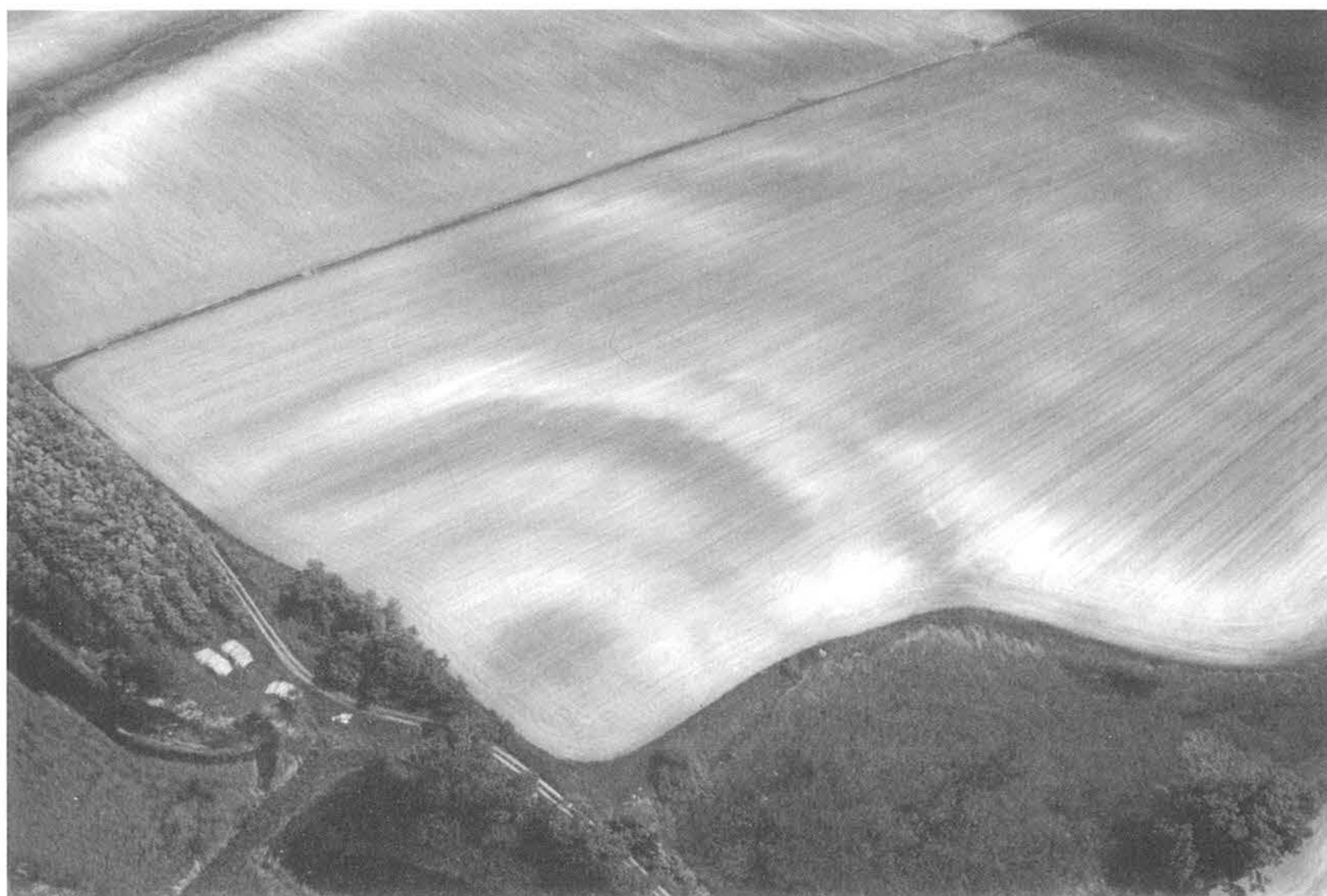
4. kép, Fig. 4: Dömsöd, Leányvár (2006. május 15.; May 15, 2006)