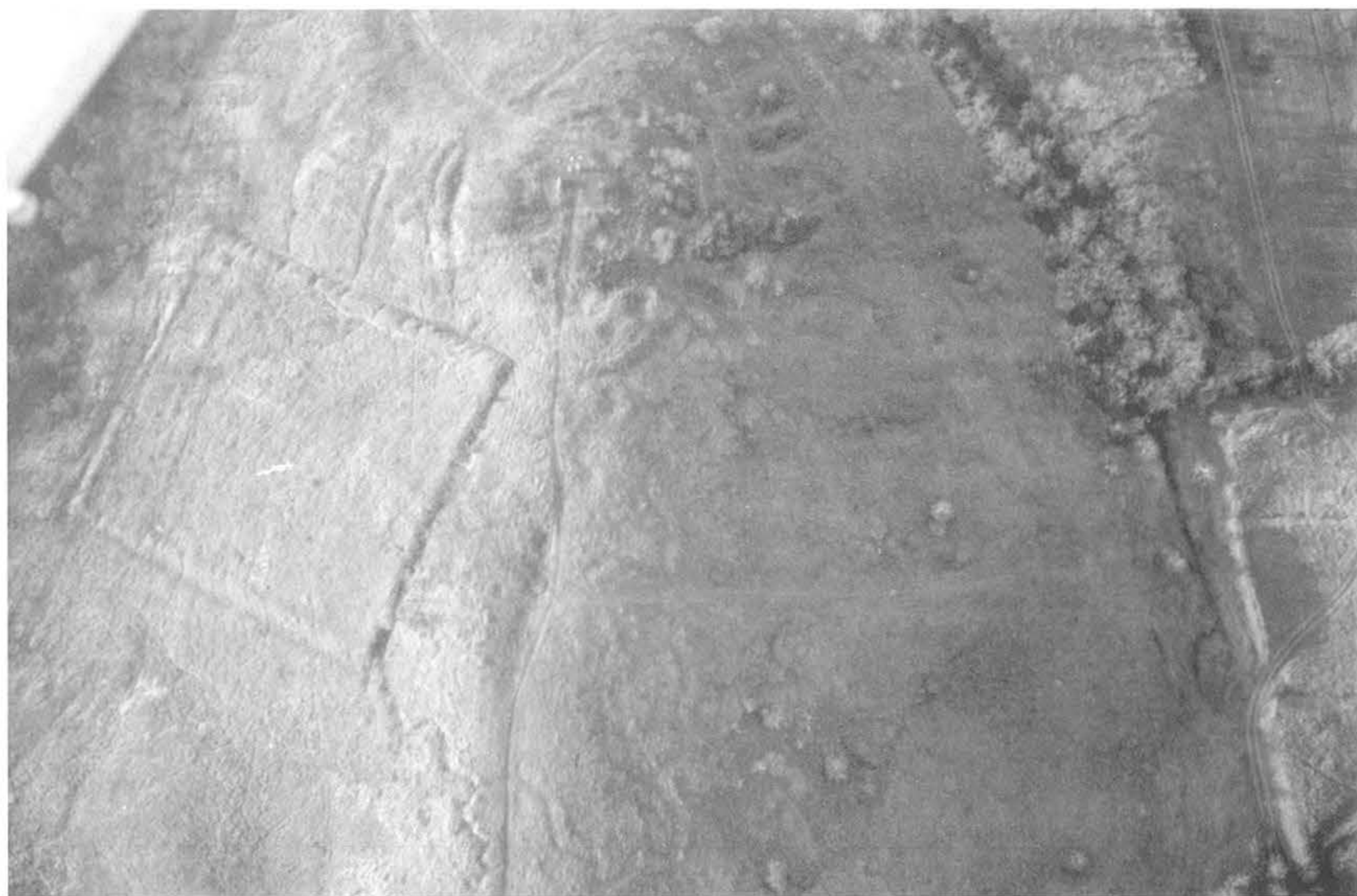
6. kép, Fig. 6: Kerepes, Kálvária (2006. december 20.; December 20, 2006)