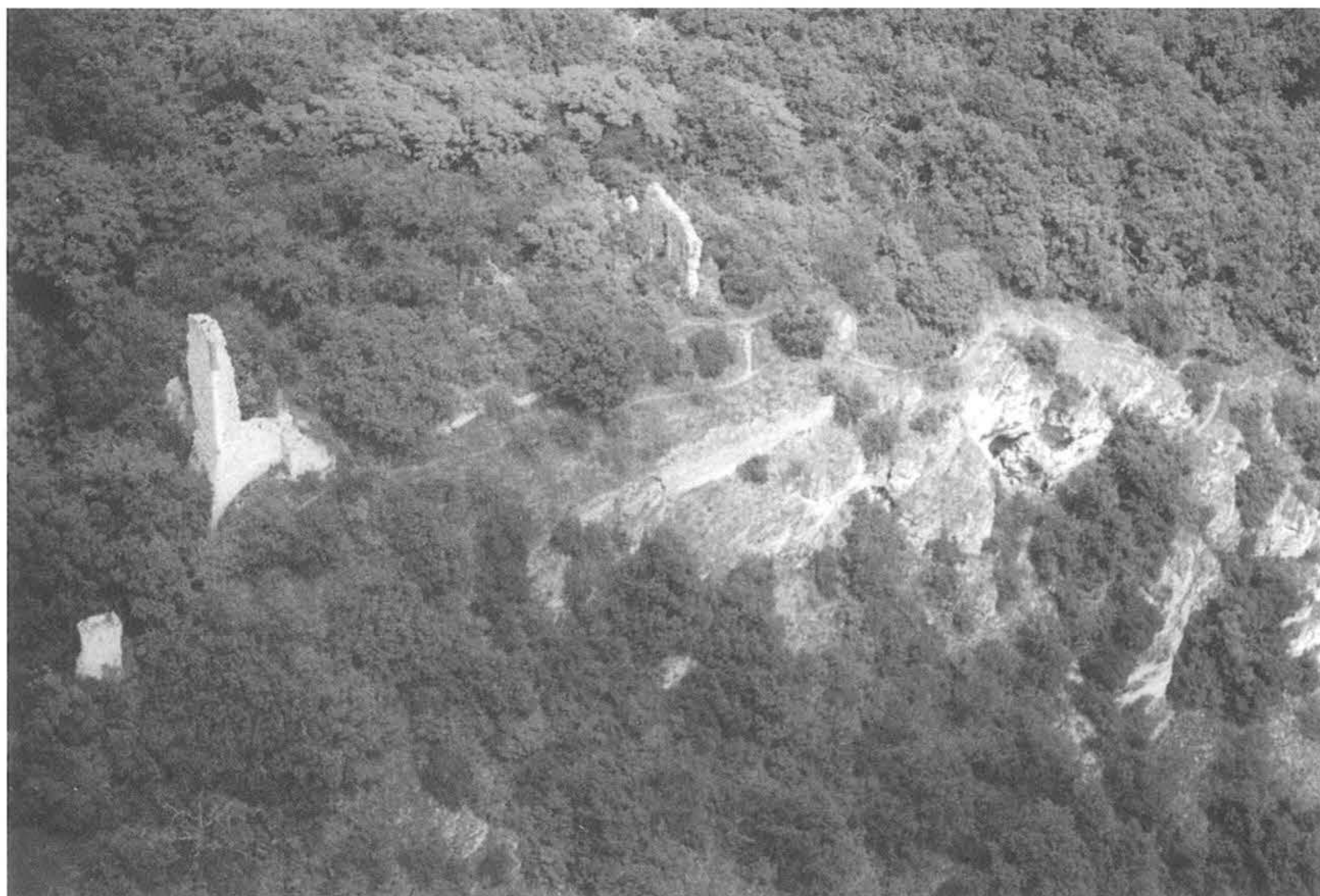
3. kép, Fig. 3: Csővár, Vár (2006. május 25.; May 25, 2006)