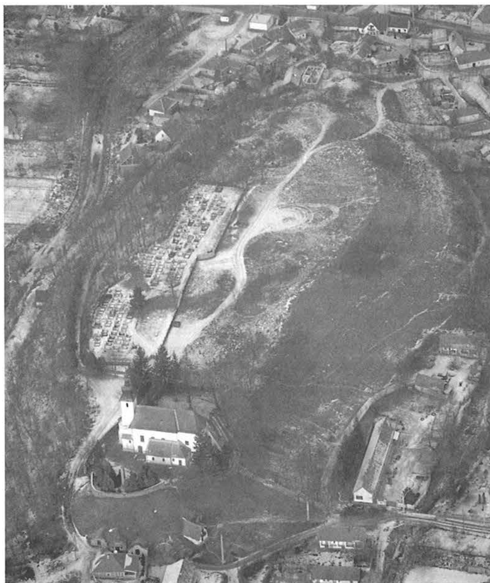
2. kép, Fig. 2: Bernecebaráti, Templom-hegy (2006. február 9.; February 9, 2006)