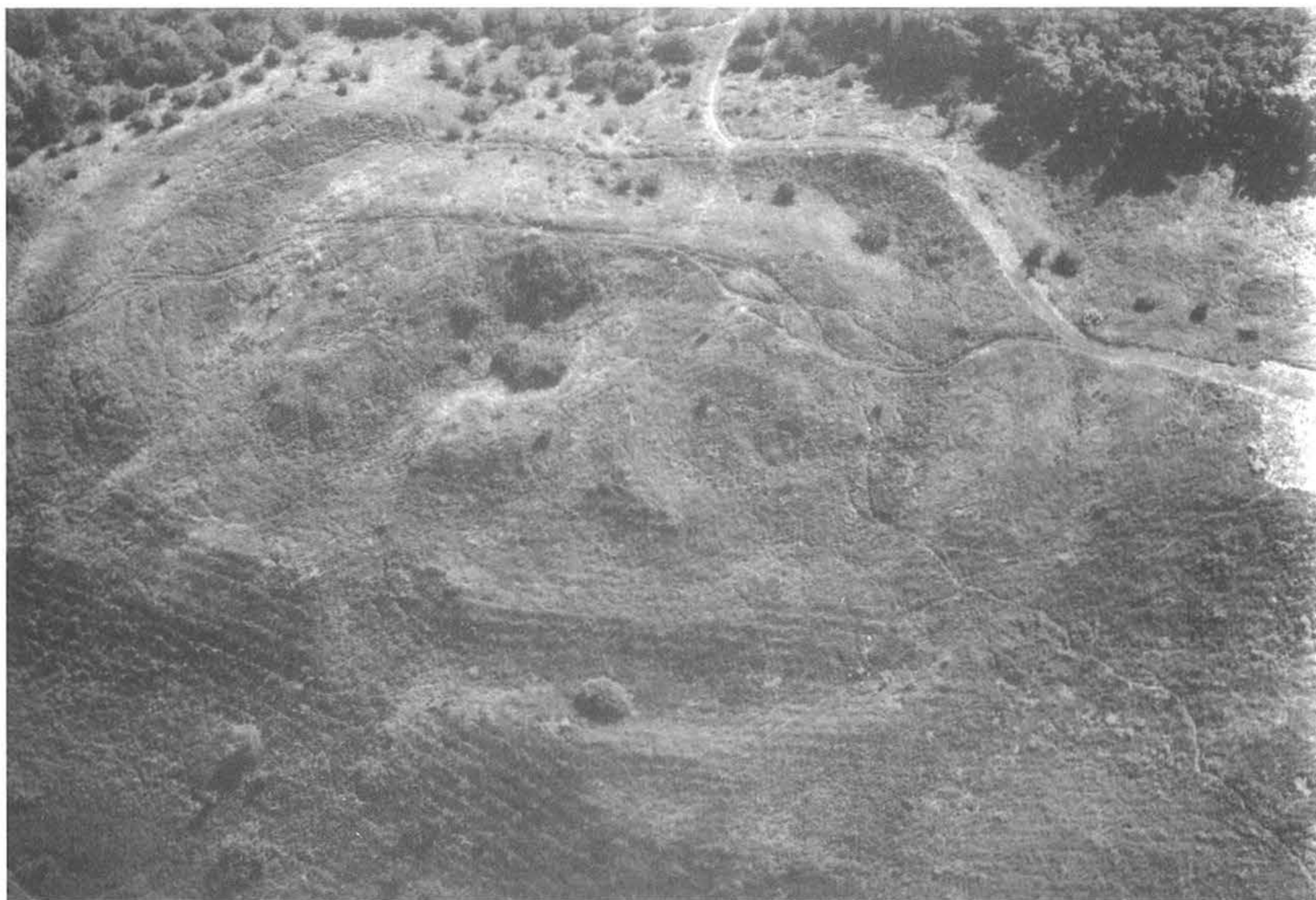
5. kép, Fig. 5: Galgahévíz, Szentandráspart (2006. július 5.; July 5, 2006)