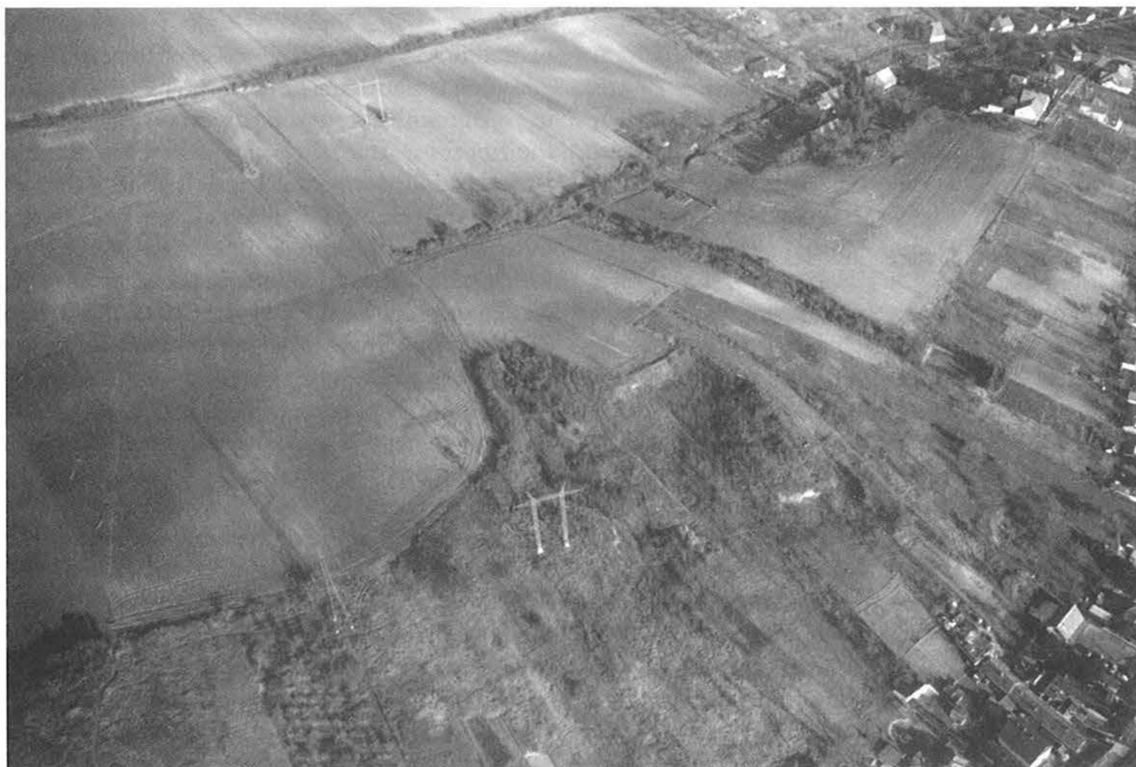
1. kép, Fig. 1: Aszód, Manyik (2006. december 20.; December 20, 2006)