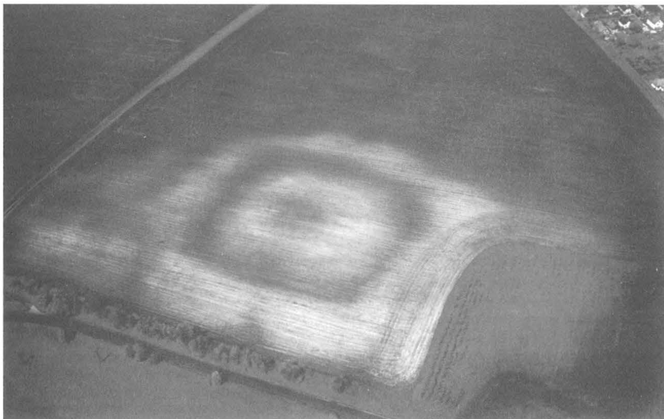
9. kép, Fig. 9: Zsámbok, Kerek-halom (2006. május 25.; May 25, 2006)