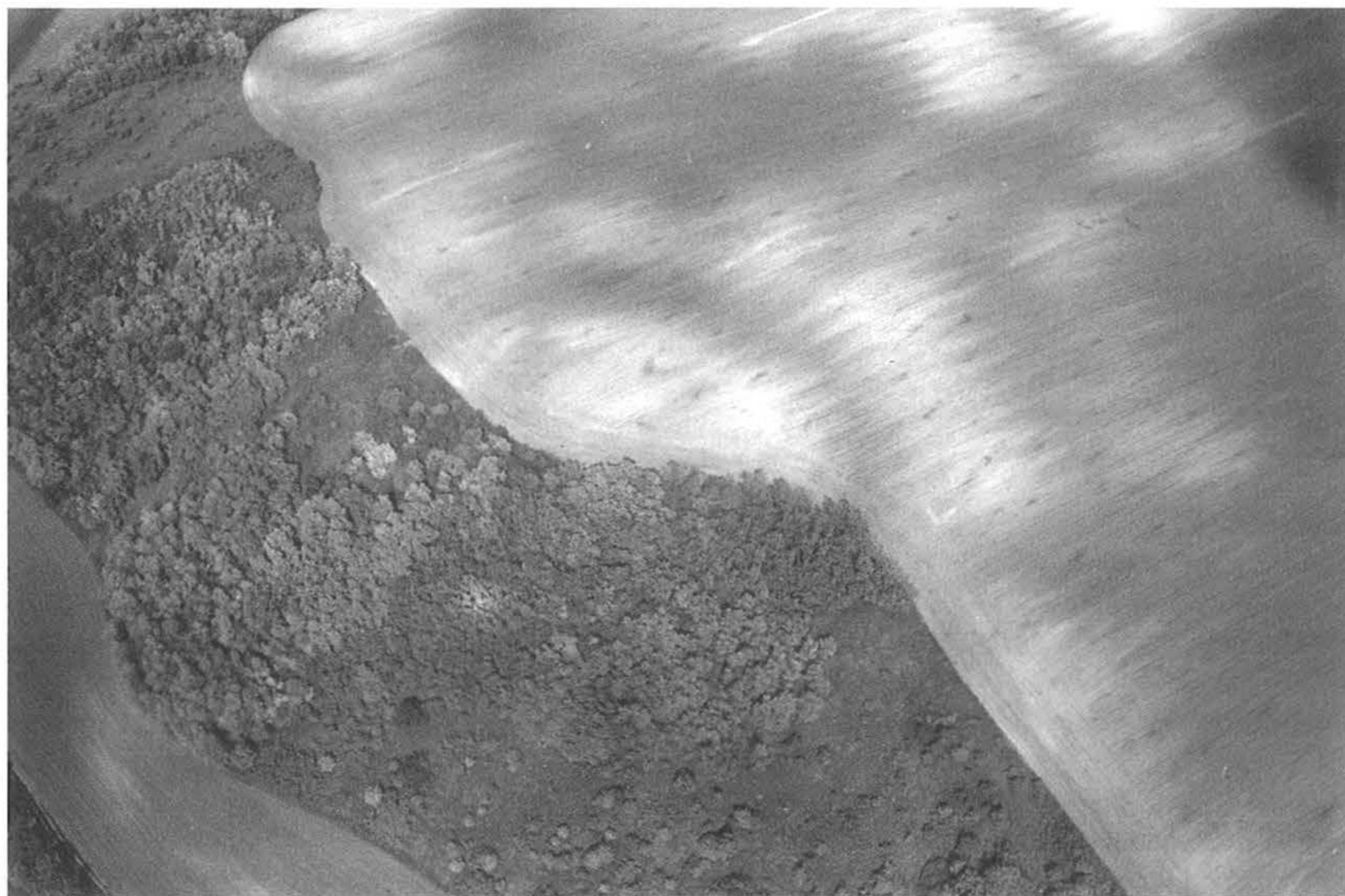
7. kép, Fig. 7: Tápióság (Káva), Várhegy (2006. május 15.; May 15, 2006)