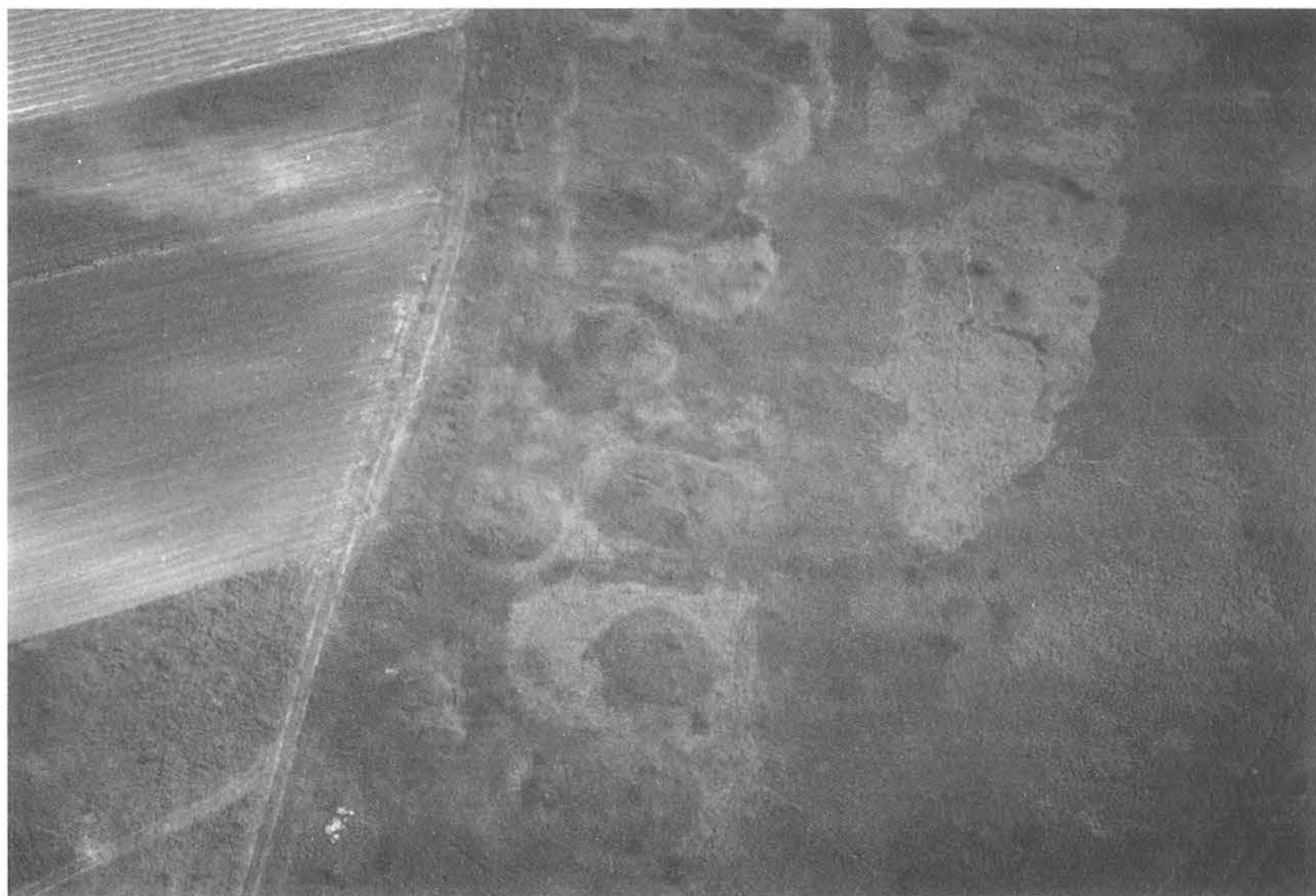
8. kép, Fig. 8: Tápiószele, Tatárhányás (2006. május 15.; May 15, 2006)